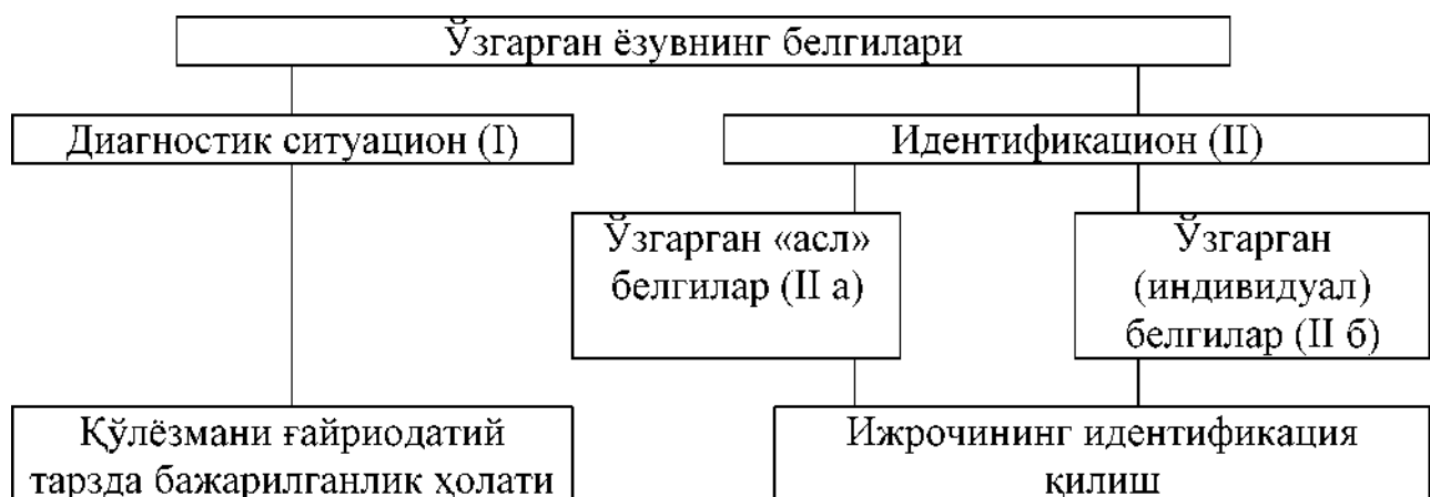
Ўзгартирилган ёзувдаги белгиларни ўрганиш схемаси

Ёзувнинг хусусий белгиларини ўрганиш қуйидагича амалга оширилади: