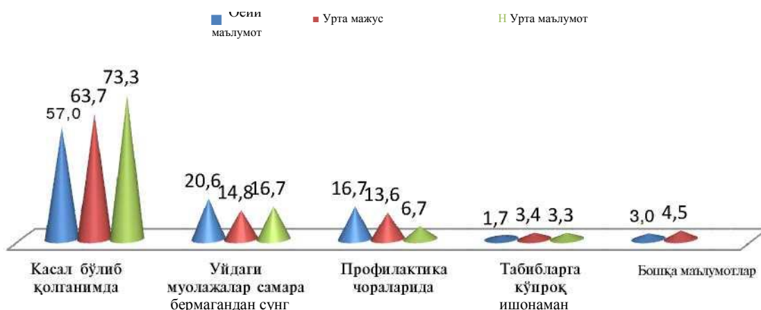
1-диаграмма. Шифокор қуригига бориш сабабларининг тақсимланиши, %.

Респондентларнинг инсон қапители ақосини ташқил этувчи таълим соқдсига инвестиция қилиш даражасининг тақдили буйиқа қуйидаги ҳулосалар ва натижалар- га қелинди. Бугунги