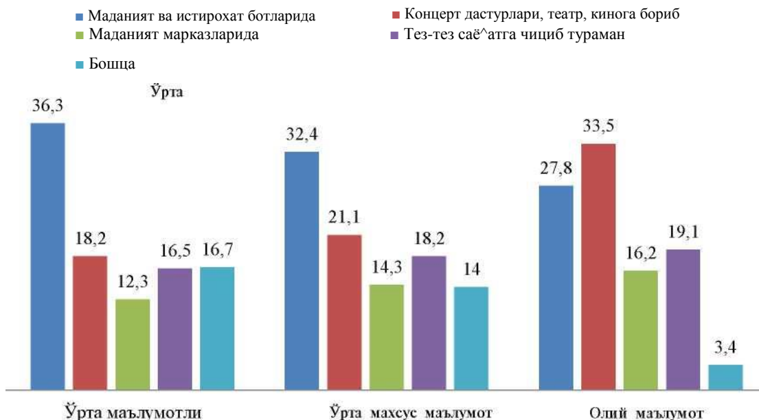
3-диаграмма. "Сиз маданий дам олишни қайси масканларда утказасиз?" деган саволга жавобларнинг тақсимаиши, %да.

жисмоний ва маънавий капитални, салоҳиятни тиклашда ҳам олиш муҳим омиллардан биридир. Респондентларга "Жисмоний ва физиологик ҳрлатингизни ва маданий эҳдиёжингизни кондириш учун қайси масканларда утказасиз?", деган савол билан мувожаат қилдик. 3-диаграммада натижаларни куришимиз мумкин.