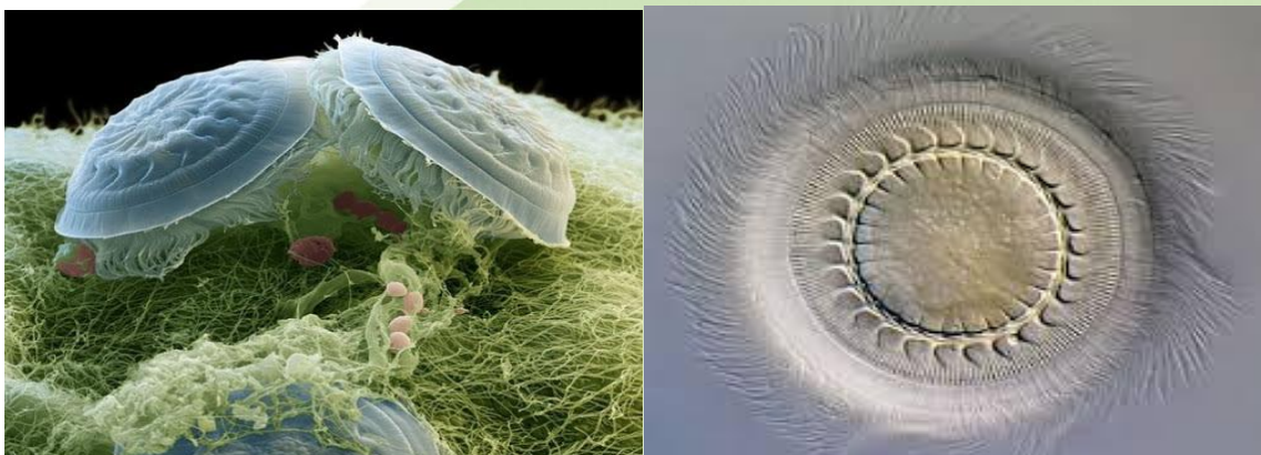
1-rasm. Kasallik qo'zg'atuvchisi. Trichodina.

Trixodinlar asosan vegetativ yo'l bilan xujayralarning ko'ndalangiga bo'linish va kon'yugatsiya yo'llari orqali ko'payadi. Trixodinalar tinim bosqichi - spora hosil qilmaydi va suvda erkin holatda 1-1.5 sutkada yashaydi. Trixodinalar orasida sovuqsevar turlaridan qishda ko'payadigan va issiqsevarlar harorat 15-27 °C bo'lganda ko'payadigan turlarga bo'linadi.