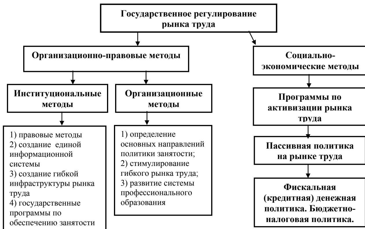
Рис. 1. Методы государственного регулирования рынка труда

На рынке труда государство выступает в роли субъекта институционального, правового, социально-экономического регулирования и с другой стороны в роли работодателя (Рис.1.).